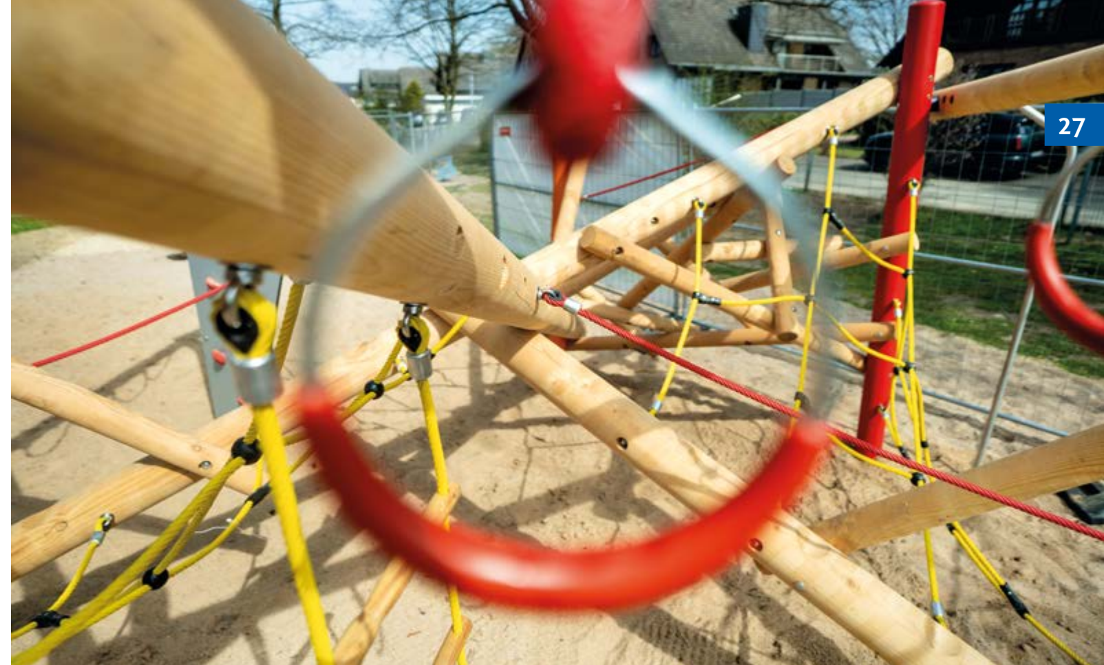
Bei den Fotoaufnahmen schütze ein Bauzaun noch die neuen Betonfundamente auf dem Spielplatz an der Talstraße. Jetzt ist auch dieses neue Spielgeräte längst Anziehungspunkt für Kinder bis 12 Jahre.