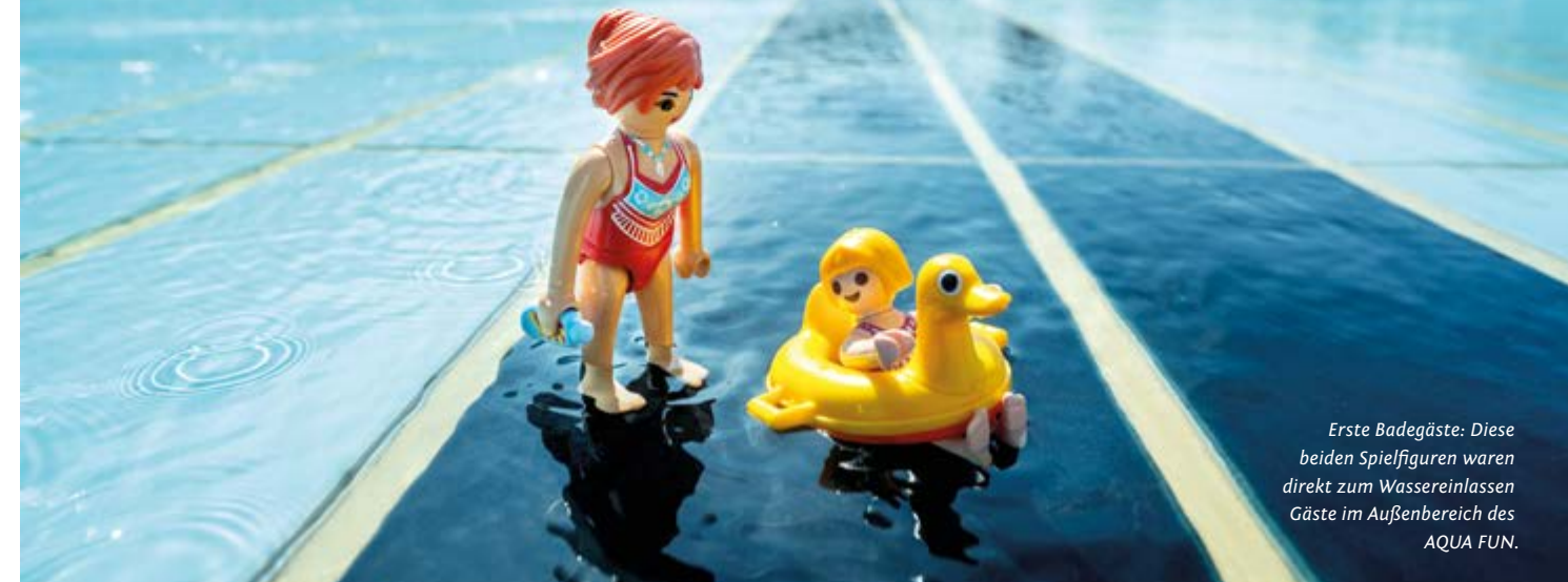
Erste Badegäste: Diese beiden Spielfiguren waren direkt zum Wassereinlassen Gäste im Außenbereich des AQUA FUN.