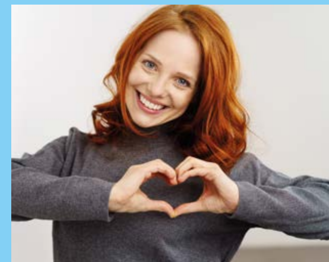
Verlässlich, ehrlich und transparent: Für diese Werte steht die Volksbank in Ostwestfalen.

Weitere Infos hier: volksbankinostwestfalen.de/ostwestfalenkonto