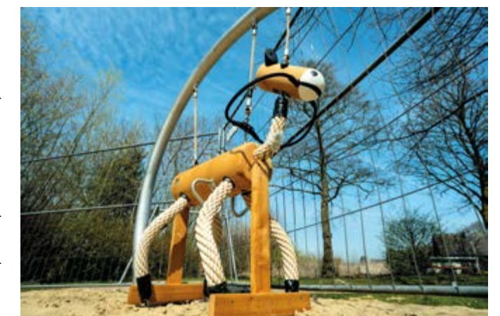
Kleiner Ausritt gefällig? Dieses Wackelpferd lädt Neugierige und Wagemutige ein, auf seinem Rücken Platz zu nehmen.

Es gab Beteiligungsaktionen mit Wunschzetteln, die später ausgewertet wurden. Parallel dazu fand eine Ermittlung der Altersstruktur statt, um hier altersgerechte Spielgeräte auswählen und montieren zu können. Während in der Talstraße noch etwas Geduld gefragt war, ehe die letzten Betonfundamente ausgehärtet waren, konnte nach der Installation im Klosterfeld direkt losgespielt werden.